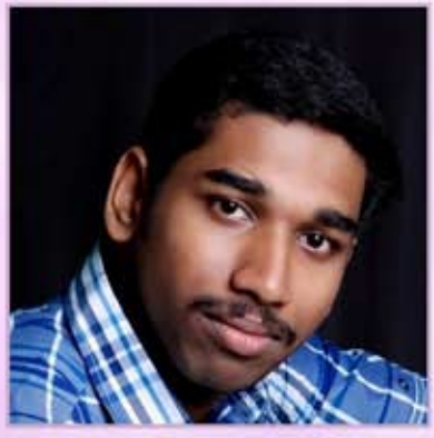
ലേഖനം: ജൂനിയർ മൂലയ്യ